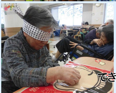
できあがりは・・・→